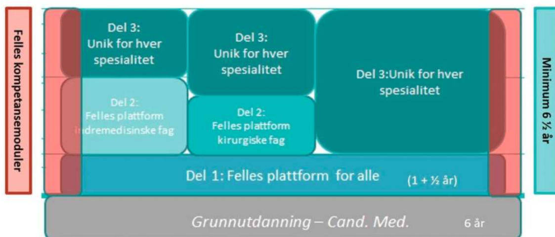
Figur 1 : Skissert organisering av ny spesialitetsstruktur.

LIS3 i allmennmedisin blir heretter omtalt som ALIS og står for allmennlege i spesialisering.