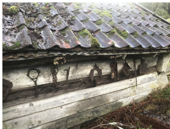
Gamle redskap