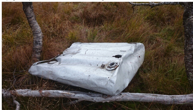
Delar frå flyvraket ved Tindfjell, Foto: Olav Eiken