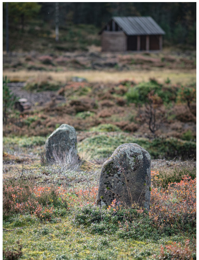
Tingplassen på Tingvatn