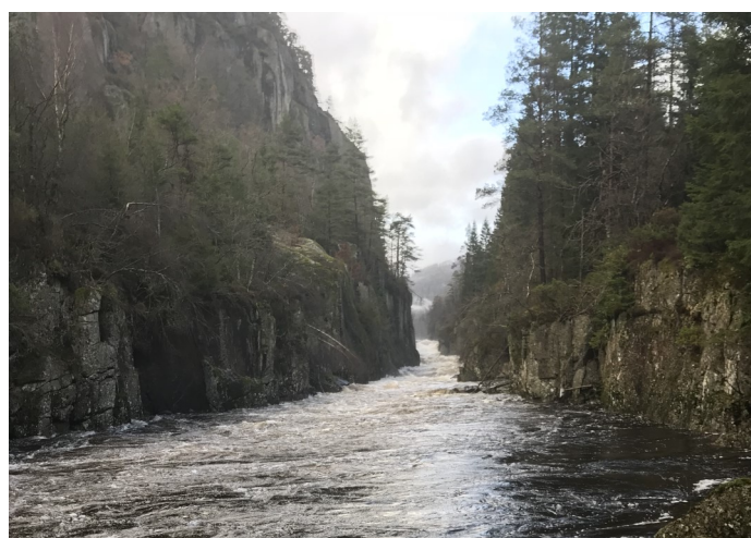
Gysfossen, 2018.