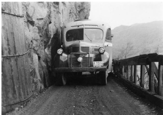
Rutebilen Hægebostad-Farsund, Jentefjellan Farsund 1940, Foto: Hægebostad billedarkiv