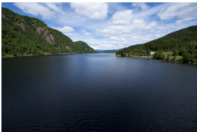
Lygna, sett frå Tngvatn