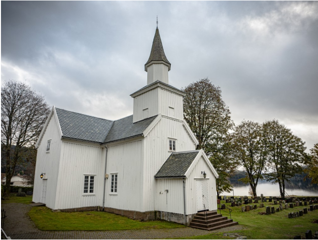
Eiken Kyrkje