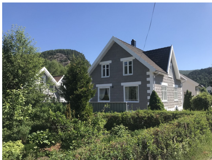
Murhus på Snartemo