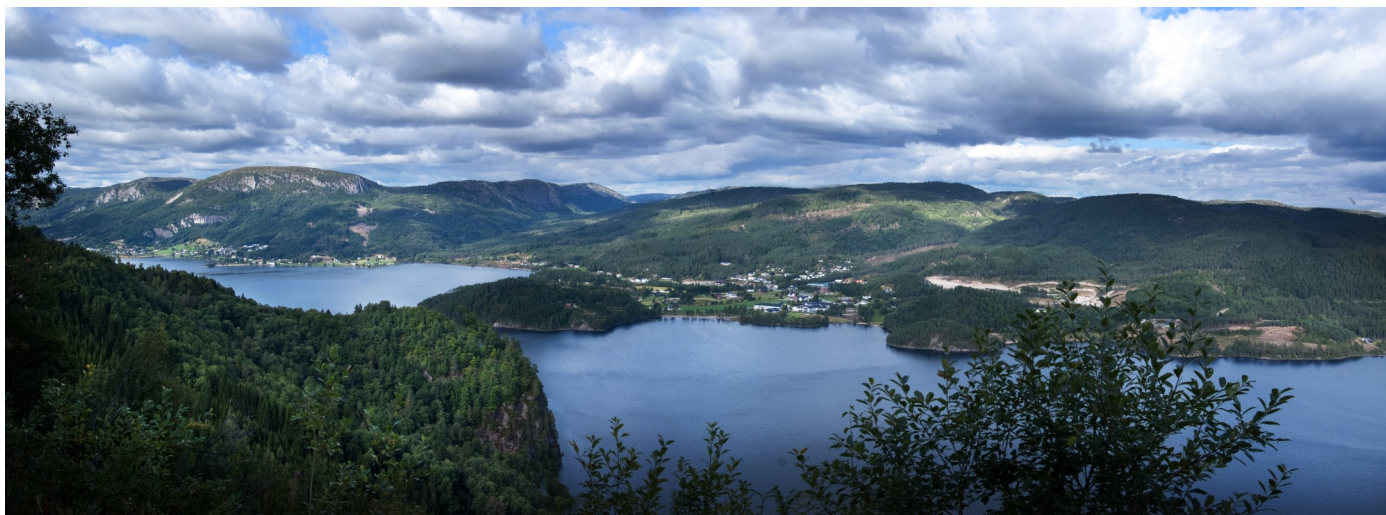
Lygne og Skeie sett frå vest.