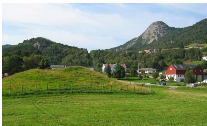
Boningshaugen på Bryggeså.