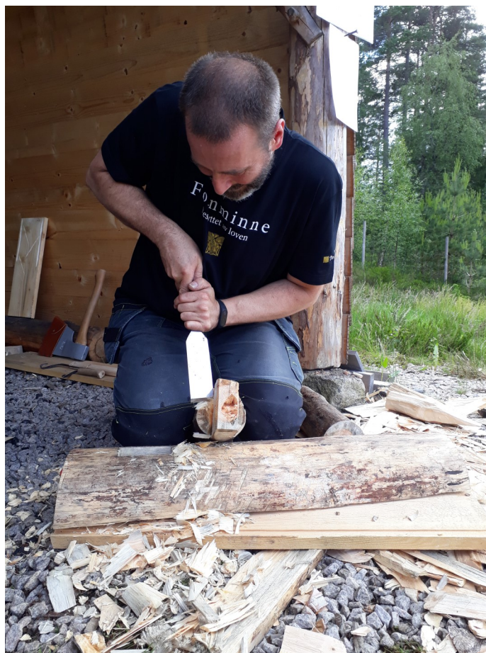
Gammelt handverk