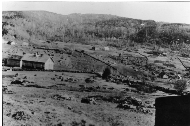
Bjærum tidlig 1920 tall, Foto: Hægebostad billedarkiv