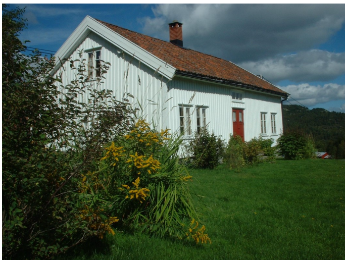
Heddan Gard

Eit godt samarbeid mellom kommune, fylke og ulike statlege instansar er avgjørande for at forvaltninga av kulturminne skal vera effektiv og god. Samarbeid på tvers av etatane i kommunen er likeins viktig for å sikre at utvikling skjer i ynskt retning.