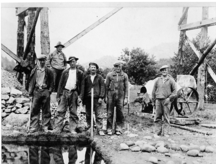
Bygging av jernbane på Snartemo i 190-åra, Foto: Hægebostad billedarkiv