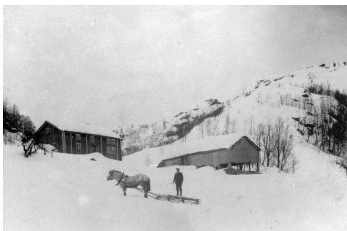
Sethueset på Urevatn ca 1930

Dei nye sparebankane – Hægebostad hadde fått sin på Tingvatn i 1864 – gjorde det mogeleg å skaffe kapital til desse endringane, medan andre hadde fått tilgang til pengar etter opphald i Amerika.