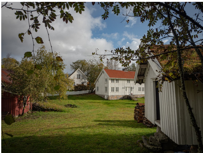
Frå tunet på Urestad