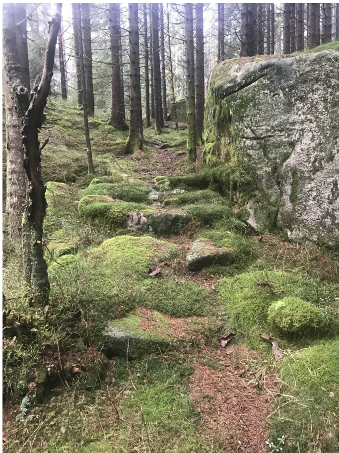
Ferdselsveg Gysland