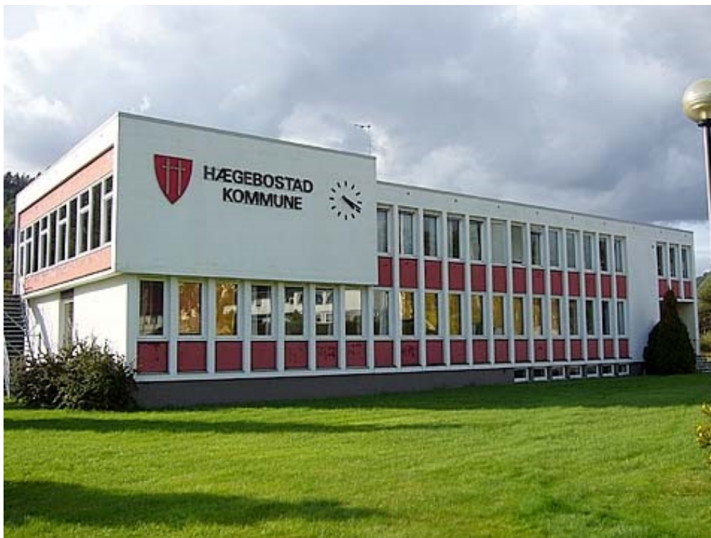
Kommunehuset, Foto: Hægebostad kommune