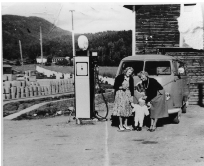
Bensinstasjonen på Birkeland ca 1953, Foto: Hægebostad billedarkiv