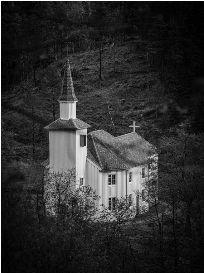
Hægebostad kyrkje, Foto: Lasse Norlemann Mathiesen