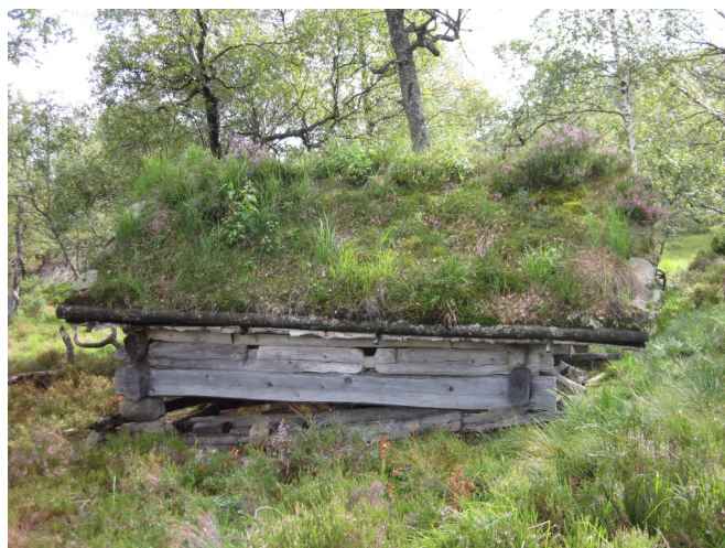
Lafta høyløe i Landdalen