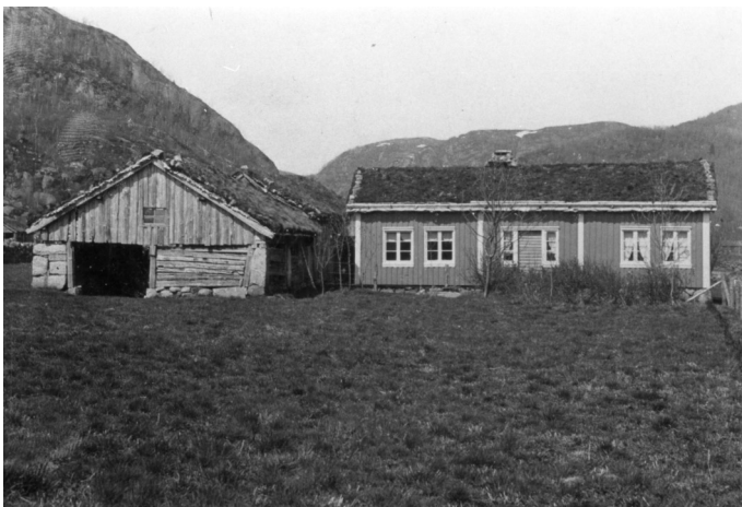
Aspågeren på Lauen ca 1910, Foto: Hægebostad billedarkiv