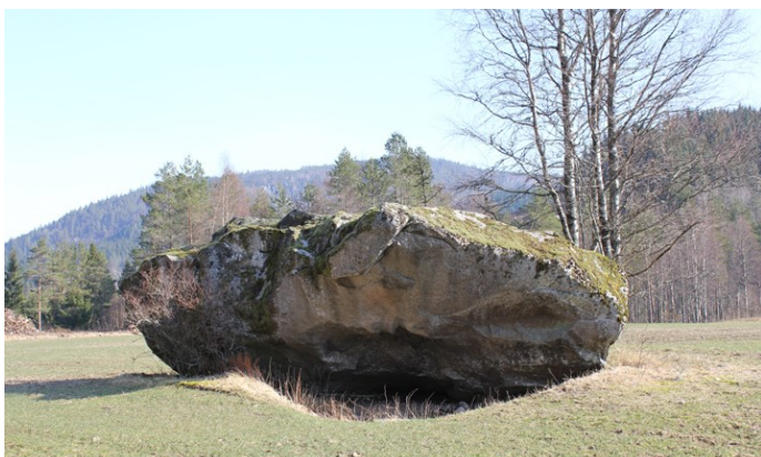
Kari med steinen på Kollemo.