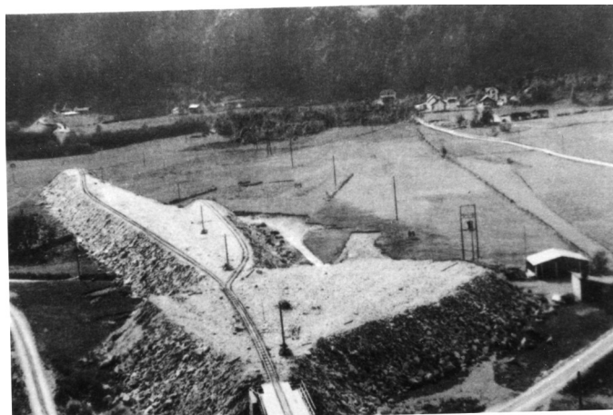
Frå bygginga av stasjonsområde på Snartemo

Kommuneplanen for perioden 2013-2023 har som overordna målsetting at Hægebostad gjennom målretta arbeid skal verte ein attraktiv tilflyttingskommune med minimum 2% befolkningsvekst kvart år, og med spesielt fokus på tilflytting av yngre kvinner.