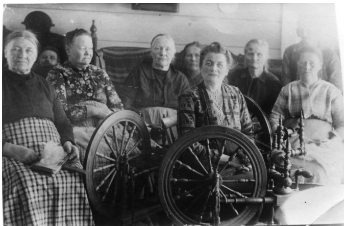
Karding og spinning på Eilevstad ca 1930, Foto: Hægebostad billedarkiv