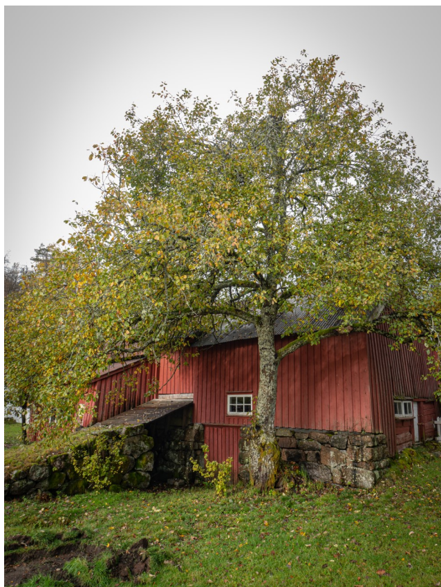
Frå tunet på Urestad , Foto: Lasse Norlemann Mathiesen