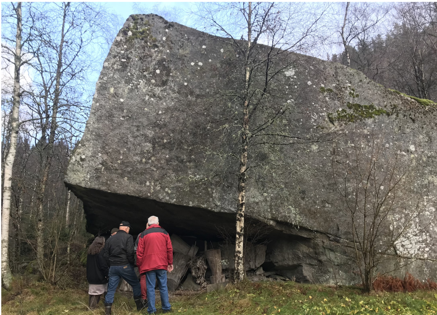
Æreneset på Gysland, 2018.