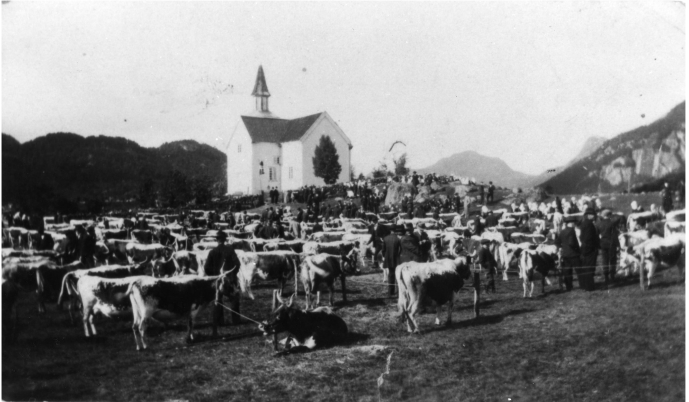
Dyrskue ved Eiken Kyrkje 1919, Foto: Hægebostad biledarkiv