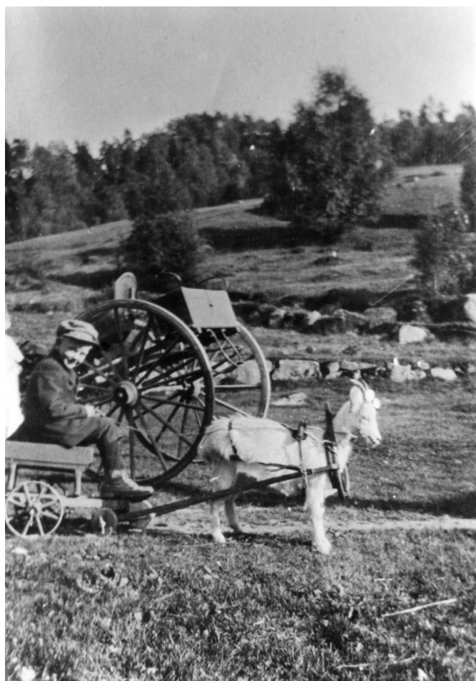
Artur Gysland ca 1912