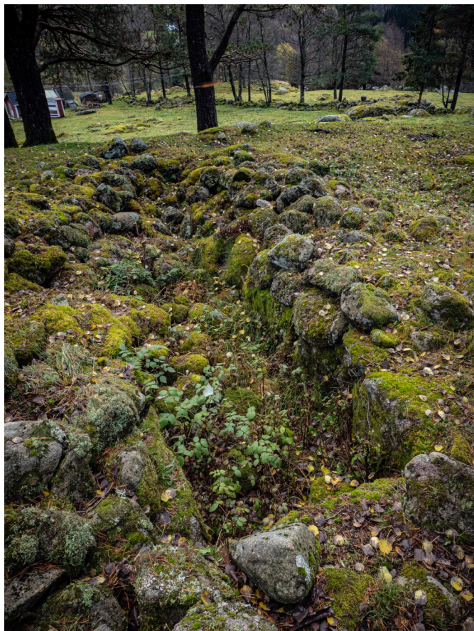
Grav Bjærum