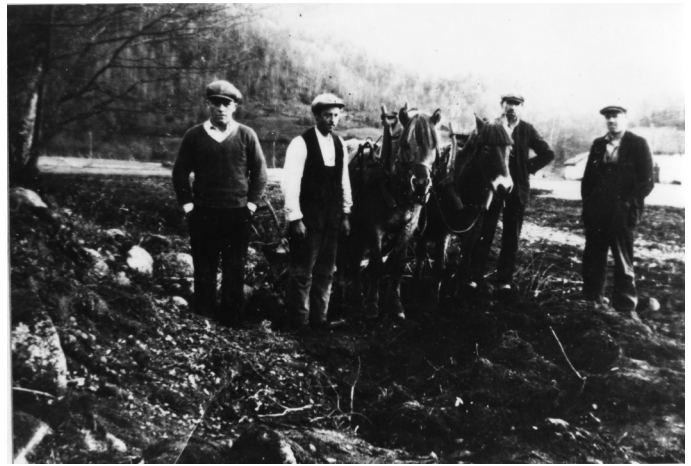
Frå pløyinga då dei fann Snartemosverdet i 1933

Men i folketradisjonen er Tingvatn ikkje ein gravplass, men ein tingstad frå den tida då bøndene sjølv dømte på tinget. Mange stader i Norden vert dei runde steinsettingane kalla «domarringar», og det er sterk og levande tradisjon for at slike monument har vore brukte i rettslege samanhang. Og nett på Tingvatn får tradisjonen støtte i andre kjelder. I mellomalderen – og kan hende alt i vikingtida – var nemleg staden sentrum i den tingkretsen som vart kalla Vats tinghå. Vats eller Vatne er eit eldre namn på Tingvatn, og garden her var i fleire hundre år tingstad for eit innlandsdistrikt som i tillegg til Hægebostad og Eiken, omfatta Bjelland og Grindheim.