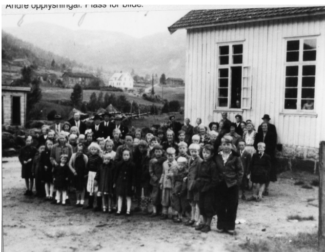
Sundagsskolen på Fåland 1953

Dei minste krinsane vart nedlagde då folketalet og talet på barn minka; Espeland alt i 1908 og Gysland i 1911.