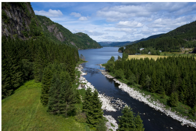
Frå utløpet av Lygne