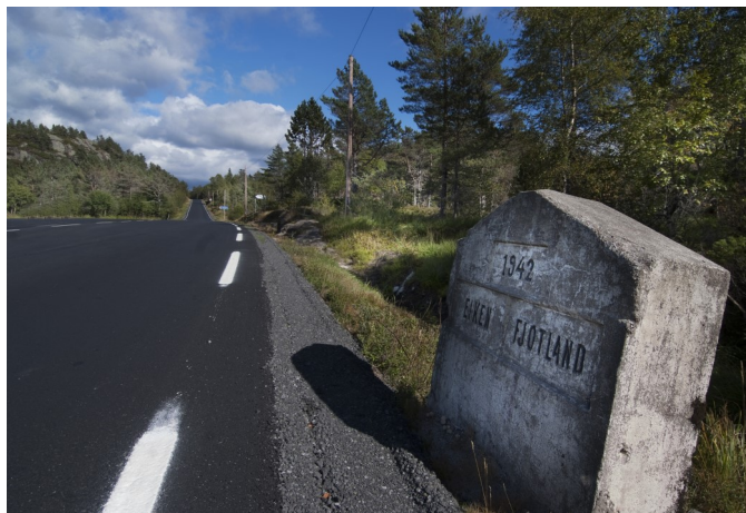
Kommunegrensa mot Kvinesdal