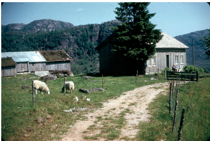
Heddan, Foto: Erling Stokkeland