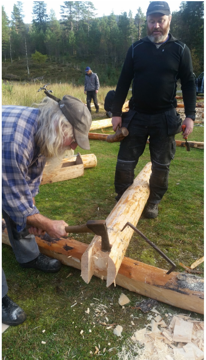
Gamle handverks-tradisjonar, Foto: Katja Regevik

Rullering av kulturminneplanen skal vurderas i planstrategien kvart fjerde år. Handlingsplanen skal vurderas i kommunen sitt årlege budsjett og økonomiplan.