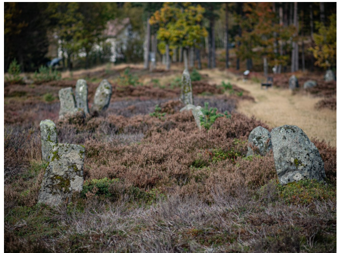
Tingplassen på Tingvatn