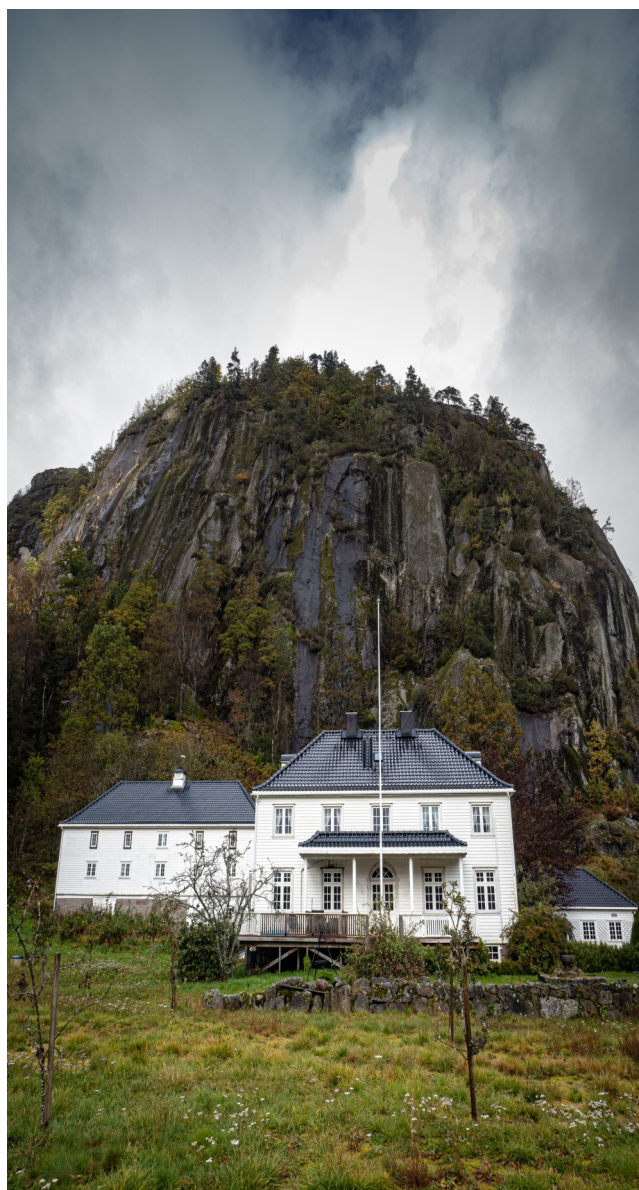
Eilevstad herregård