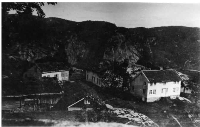
Urestad ca 1940, Foto: Hægebostad billedarkiv

Kulturlandskapet i Hægebostad fortonte seg annleis i 1801 enn no. Opp gjennom dalen låg gardane om lag på same plass som nå, men mange stader låg husa til dei ulike bruka om kvarandre i ei klynge, mest som små landsbyar. På Lauen hadde så mange som 12 hushald, bygningane sine i ei klynge, og på Skeie låg 10 bruk samla. Mindre gardar, ikkje minst på heia, var einbølte.