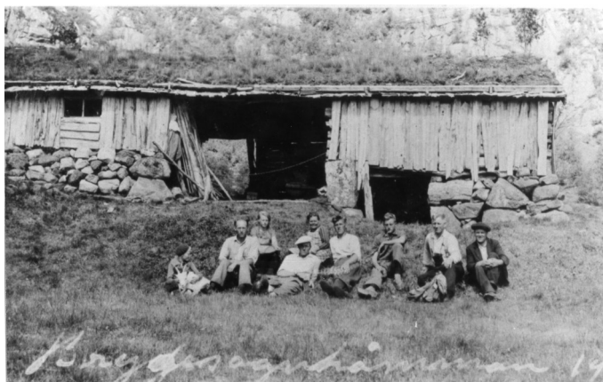
Bryggesåhommen 1938, Foto: Hægebostad billedarkiv