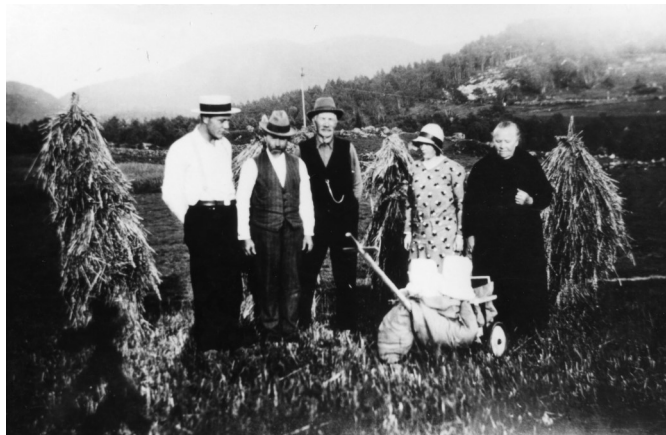
Bjærum tidlig 1933

Ein kunna ta varslar av så mangt. Julaftan kunne ein ta «tvora» som hadde vore nytta til å røre i grauten, og gå baklengs andstølt kring badstova tre gongar. Gjorde ein det, ville den som ein skulle gifte seg med, komme og sleike tvora. Det heiter seg at då dei ein gong skulle bygge ny kyrkje i Eiken, la