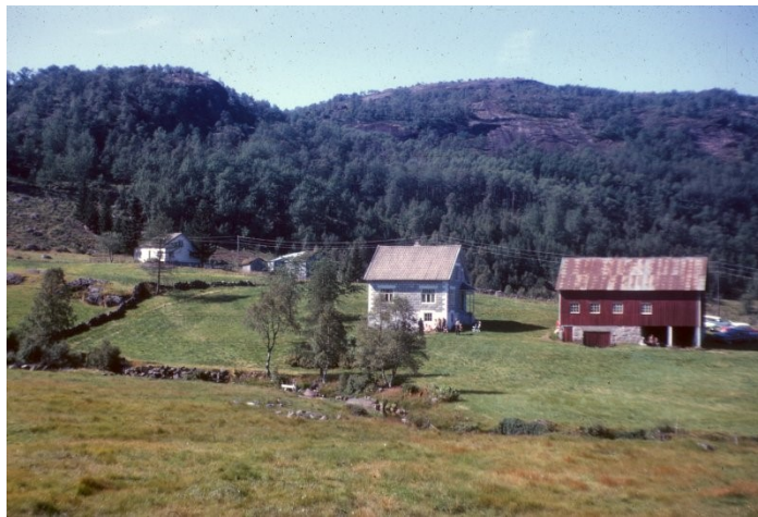
Heddan Gard