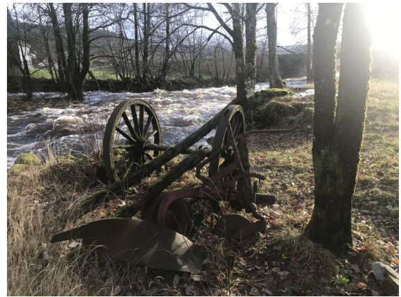
Redskap for pløying

Kulturminnelova sitt føremål (§1) er at «kulturminne og kulturmiljø skal vernast som del av kulturarven vår og identiteten vår, og som ledd i ei heilskapleg ressursforvaltning. Det er eit nasjonalt ansvar å «ivareta desse ressursane som vitenskapleg kjeldematerial og som varig grunnlag for nolevande og opplevinga til framtidige generasjonar, sjølvforståing, trivsel og verksemd. Når det etter anna lov vert gjort vedtak som påverkar kulturminneressursane, skal det leggjast vekt på føremålet til denne lov.»