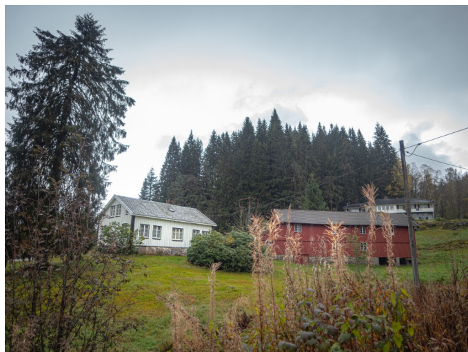
Gårdstun Gysland