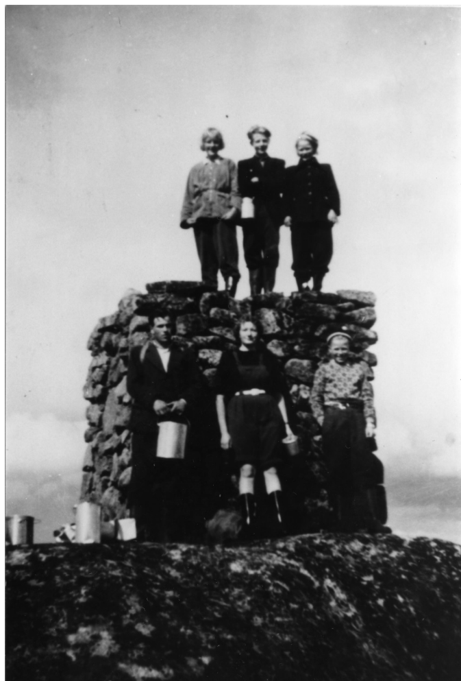
Tindfjell 1940

I mellomalderen hadde øl vore den viktigaste drikka til kvardag og fest, og det var påbode å brygge øl og halde øllag. I kystdistrikta hadde myndigheitane fått meir kontroll over alkoholbruken på 1700-talet; der hadde pietisme og nye skatte- og avgiftsreglar endra den gamle drikkekulturen. Den tradisjonelle drikkekulturen haldt seg imidlertid mykje lenger i bygdene våre. I Eiken haldt ein framleis øllag då Eilert Sundt besøkte bygda midt på 1800-talet, og folk der fortalde at dei