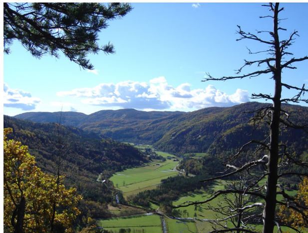
Utsikt mot sør over Gybergsletta,

Nokre bygningar frå Hægebostad er flytt mykje lenger. Norsk Folkemuseum i Oslo har eit bur frå Hobbesland, som vart flytt i 1930. Hobbeslandsburet er eit langbur i ei høgd, med to rom – eit til matvarer og eit til klede. Det er truleg frå 1651, å dømme etter eit årstal som er rissa inn i dørstokken.