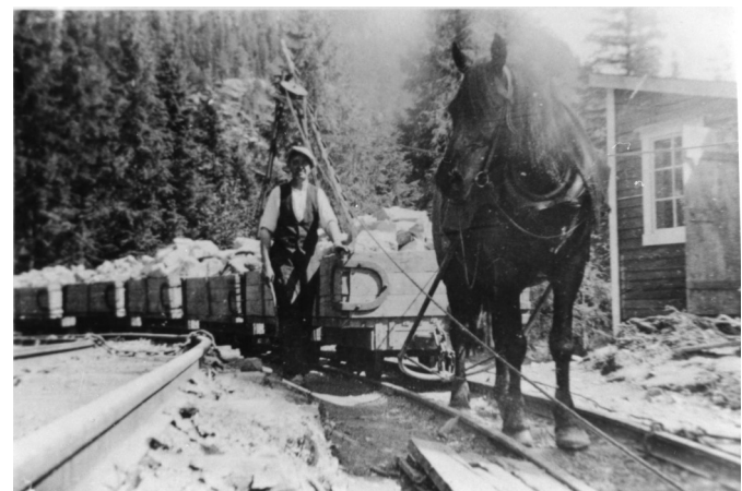
Transport av tunellmasse frå Hægebostadtunnelen 1936