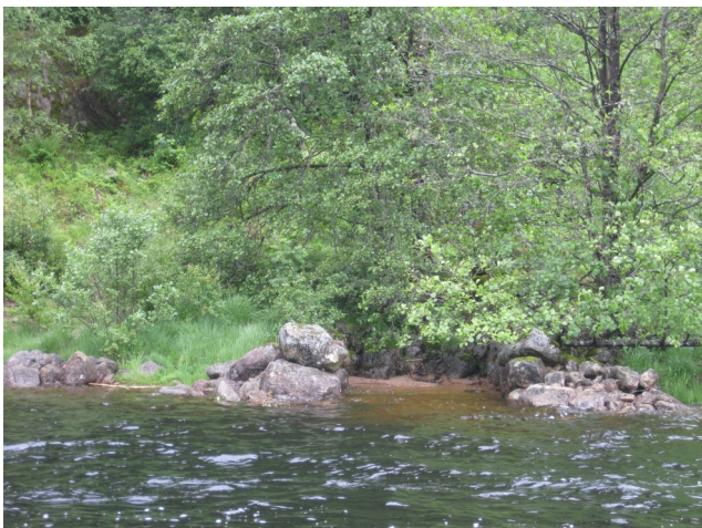
Båtstø på vestsida av Lygne