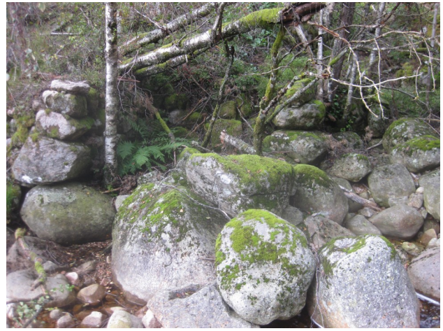
Kvernhusmurar på Garden Eiken