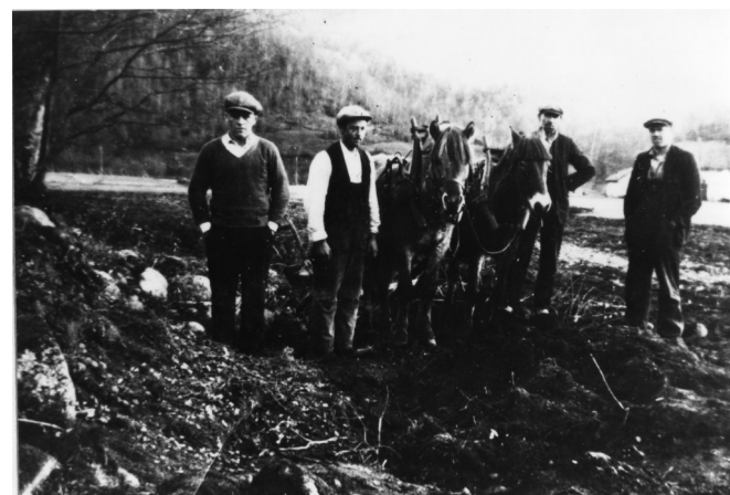
Pløying då dei fann snartemosverdet i 1933

hadde høyrte at kongen hadde befalt at ein måtte halde gjestebod med øl.