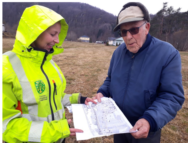
Frå befarung på Snartemo