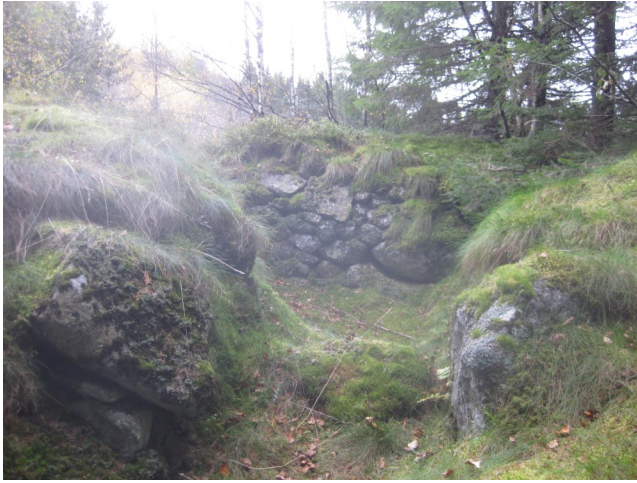
Potetkjellar på Skytel