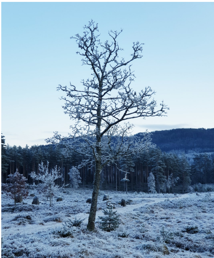
Tingplassen, Foto: Katja Regevik , Vest-Agder-museet