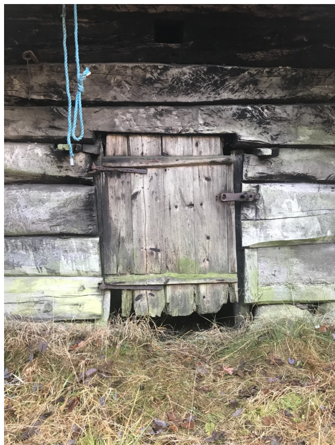
Bygning på Gysland