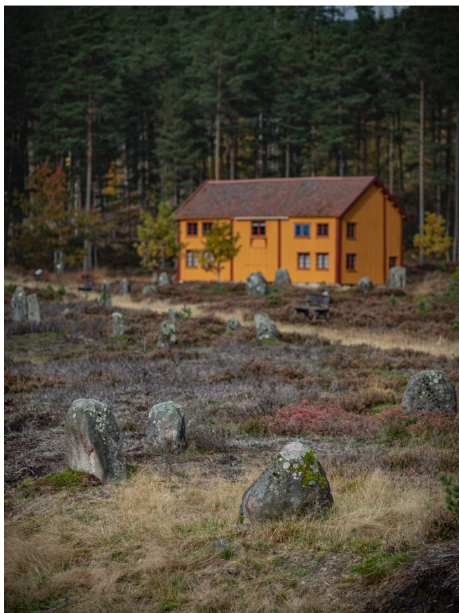
Bygdemuseet på Tingvatn