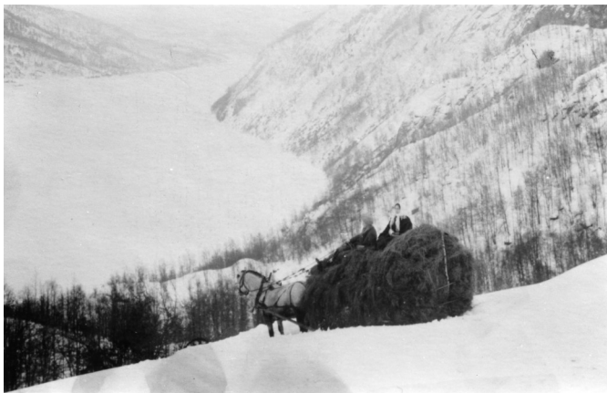
Heimhenting av høy ca 1930