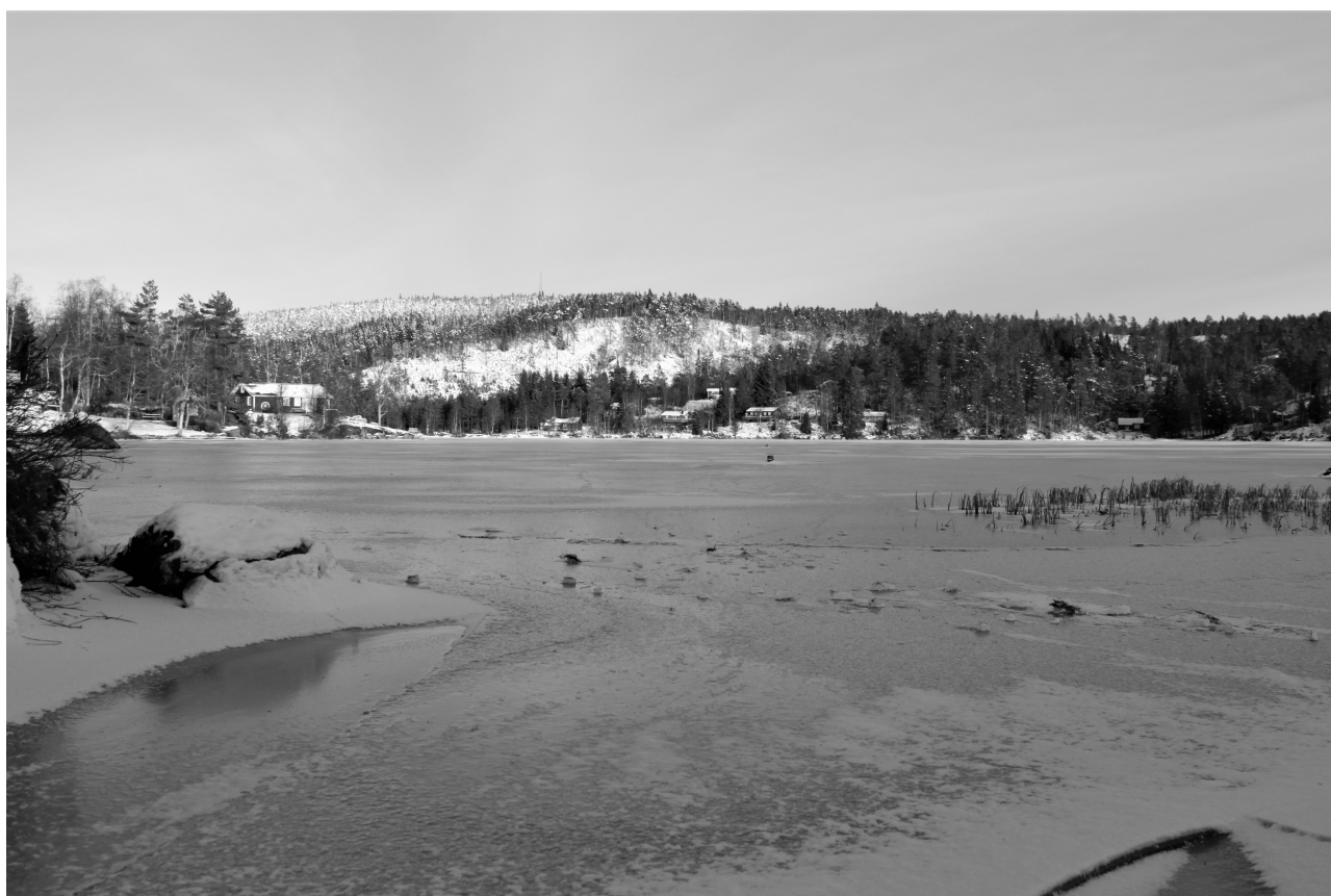
Islagt Bjennvann, Naglestad, januar 2021.